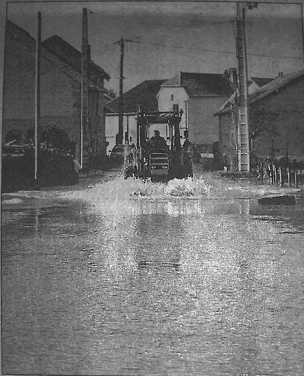
Pour traverser le village de Les Aynans, le tracteur était le seul moyen de locomotion.

Dimanche matin, certains villages du secteur luron se sont réveillés les pieds dans l'eau. De nombreuses routes étaient encore coupées hier peu avant midi, comme dans le bas de Vouhenans, aux Aynans où il était impossible d'emprunter la RD 122 à moins d'être équipé de tracteur. En début d'après-midi, Odile Lamboley, maire des Aynans, confirmait que la décrue était amorcée. « Dans la nuit aucune personne n'a dû être évacuée, même si certaines maisons sont entourées d'eau », précisait-elle.