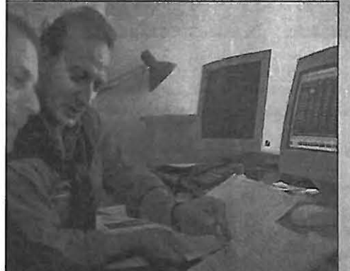
Les données recueillies par les stations d'observation automatisées et ensuite transmises à la préfecture.