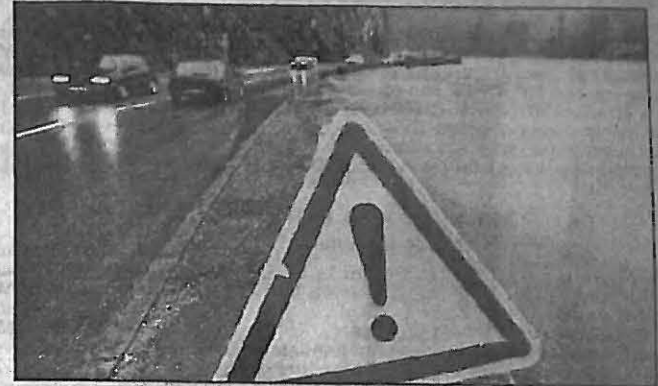
A la sortie de Besançon, sur la route 83, le Doubs a commencé à envahir la route nationale.

Près de 500 hommes des centres de secours et brigades de gendarmerie ont été mobilisés sur le terrain. Et quelque 350 interventions ont été notées, dont une occasionnée par un cynique restaurateur de Roye qui avait cru bon véhiculer sa clientèle avec son 4X4 malgré les avertissements des sapeurs-pompiers. La situation restait hier soir préoccupante puisque la forte décrue constatée dans la nuit de samed