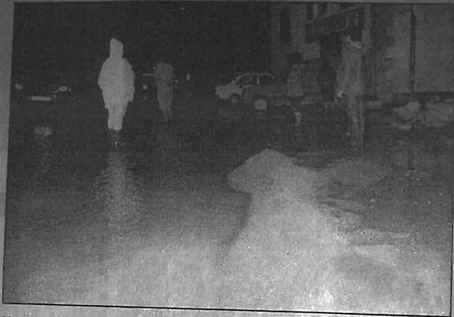
Un torrent d'eau a dévalé toute la route avant de s'engouffrer chez les riverains.

L'alerte a été donnée à Vy-lès-Lure dimanche à 23 h 30. Les pompiers luxeuiliens sont intervenus rue de Mollans où des torrents d'eau empruntaient la route après avoir dévalé les finages qui dominent la commune à l'ouest. Les terrains gorgés d'eau n'ont pas pu absorber l'énorme quantité tombée entre 21 heures et minuit dimanche soir. De surcroît, la buse qui reçoit les eaux des fossés de la route est quelque peu sous-dimensionnée.